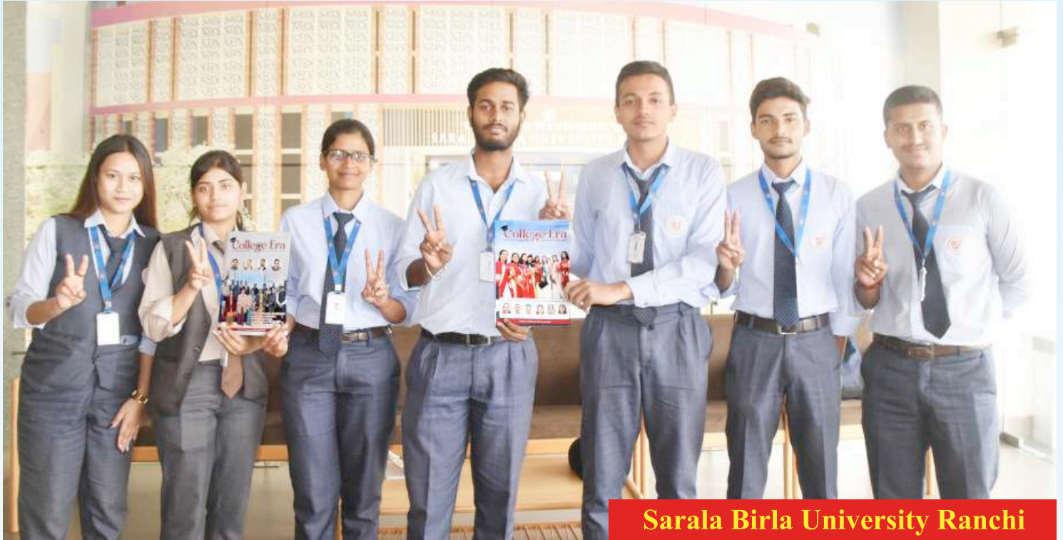
Sarala Birla University Ranchi